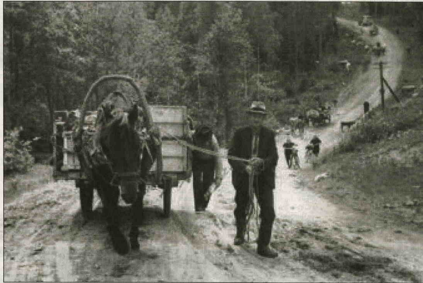
Kesällä 1944 evakkotielle joutui runsaat 400 000 karjalaista.

Paasikiven hallitus antoi ruotsalaispykälän sisältäneen lakiehdotuksen eduskunnalle tammikuussa 1945. Sen mukaan siirtolaisasutus ei saanut heilauttaa kuntien kielisuhteita millään tavoin. Eduskunnan suuri valiokunta väljensi pykälän kielilain