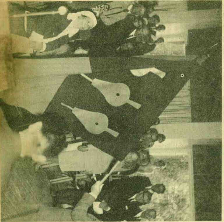
Pälkjärven pitäjässään lippu vihittiin 6. 7. 1969 seurau 20-vuotis-juhlissa Joensuuassa.

kun kunnan väestö joutui evakko-tielle, määräsi valtiolta kunnan hoitokunnan niissä oloissa hoita-maan kunnalle kuuluvia tehtäviä. Jatkosodan aikana, kun luovutettua aluetta vallattiin takaisin, asetettiin kuntaan sotilashallinnon alainen kun-nan esikunta, joka ohjasi kuntaan uudelleen asutusta, apunaan kunnan hoitokunta. Tätä uutta asutusta ja jälleerakentamista ryhdyttiin innok-kaasti suorittamaan. Kun kunnan alue oli toistamiseen valloittajalle luovutettu, seurasi tästä, että kunta- oli virallisesti lakkautettava. Kun-nan hoitokunnan oli tehtävä kunnan loppuseivitys, arkisto järjestettävä ja toimitettava Maakunta-arkistoon. Kunnat lakkautettiin virallisesti 30. päivänä syyskuuta 1948. Silloin Pälkjärven kuntakin lakkasi ole-masta ja nimi jäi vain vain historian lehdistö. — E. K.