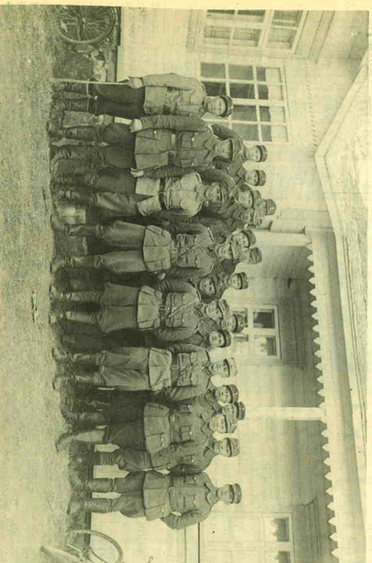
Er P 3:n tulenjohtopöytäkuva kuvattuna Virolahden Ala-Pihlajassa Värin talon pihalla sodan loput-tua.

Tätä hyökkäysoyrytystä kutsut-tiin jälkkäkeen vähenmään marrit-teluväle Jemppimillä. Sen valmistelua leinasi kiireys ja haparoin-ti, joukkojen myöhästeleminen se-kä epätarvikkokemunkkainen salaaminen. Ilmeisesti tästä syystä mie-hiä puuttui usko yrityksen on-nistumiseen eikä hyökkäyksessä ollut täyttä portta. Varmasti ei hyökkäys kuitenkin ollut merkit-tykseen, sillä se lienee sekotta-nut vihollisen suunnitelmia ja myö-hästyttänyt sen uusien hyökkäys-ten alkua.