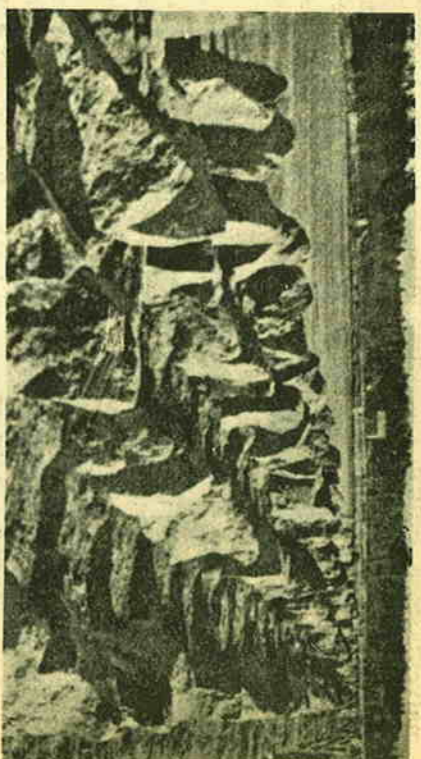
Panssarivammausteet halkoivat Heinjoelakin viljelysmaita ja metsiä.

Osallistuksessaan puolustustaiste-luihin Pasurin lohkolla miehititi 2. patteri tulenjohtopaikat Sarkolan suunnassa ja 3. patteri aluksi Me-riinladedä ja myöhemmin Pasu-rinladedä. Tuhaasemat olivat niin-kuin pyssäkin lähellä. Pasurin loh-kolla viivryttiin joulukuun 22. pä-ivän saakka. Taistelutoiminta oli tällä aikana melko vähäistä, tykis-tön ja kranaatitehtimistöön häirin-tä tulla ja pikkukuhakointua. 12. 12. käytiin Pasurin tienhaaran maas-tossa kahakka, johon myös esikun-tapatterin kuuluvat Heinjoen pojat osallistuivat ja tietävästi vielä