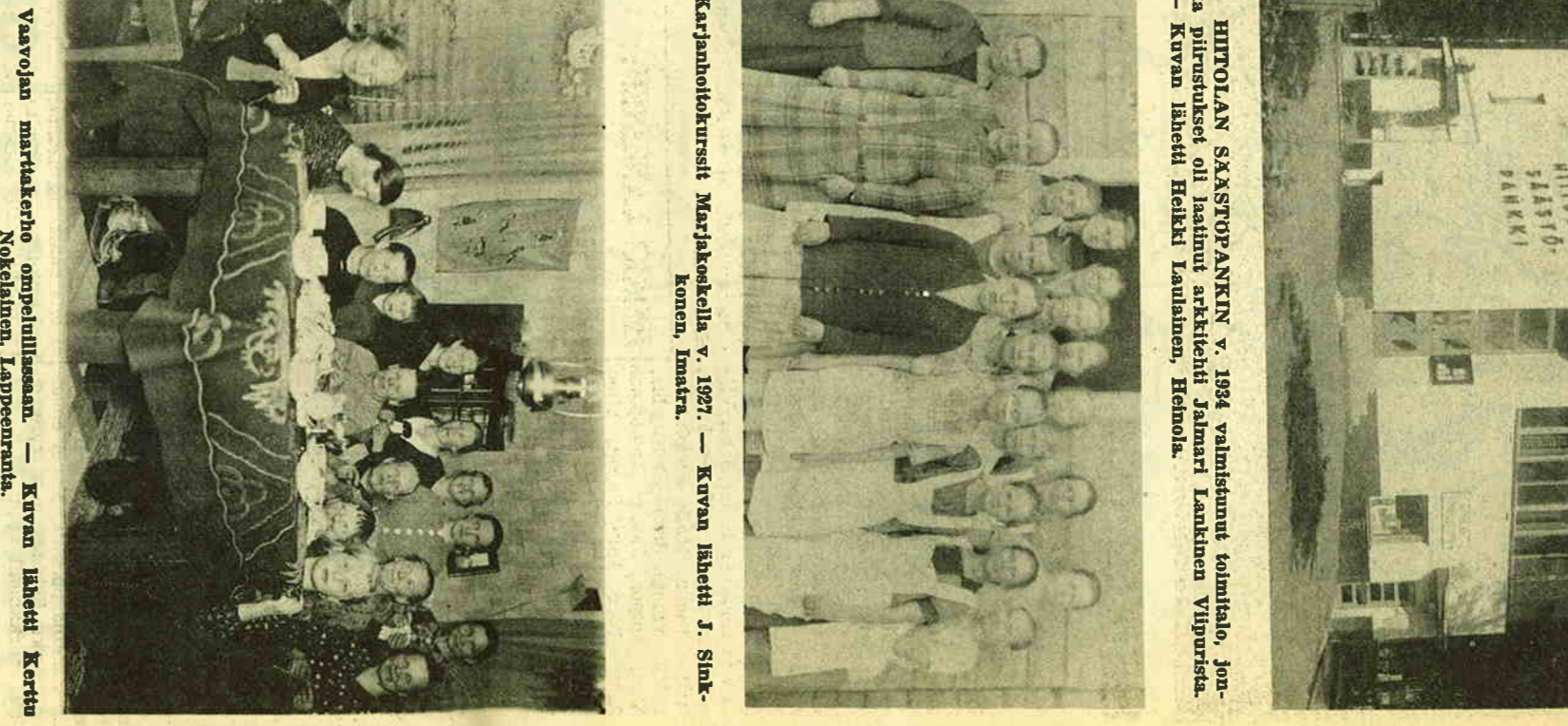
Hiitolan säästöpankin v. 1924 valmistunut toimitalo, jonka pirtustukset oli laatinut arkkitehti Jalmari Lankinen Viipurista.

Hiitolassa toimi lisäksi pienem-piä osuusloiminnaalisia yhtiymiä ja osuuskaunta eri puolilla pitäjää. Hiitolaiset olivalsivat yhteistoiminnan ja osuusloiminna merkityksen siksi he olivat liittymään niihin jä-senkisi ja toimivat niissä. Näiden osuusloiminnaalisten laitosten an-siosta kohosi Hiitolan taloudealli-nen elämä ja vauraus huomatta-vasti 1920 - 30 - luvulla. Hiitolai-set ymmärsivät, että yhteistoiminnasta on voimaa. Senatkaisesta toi-minnasta on enää vain muistot jäl-jellä.