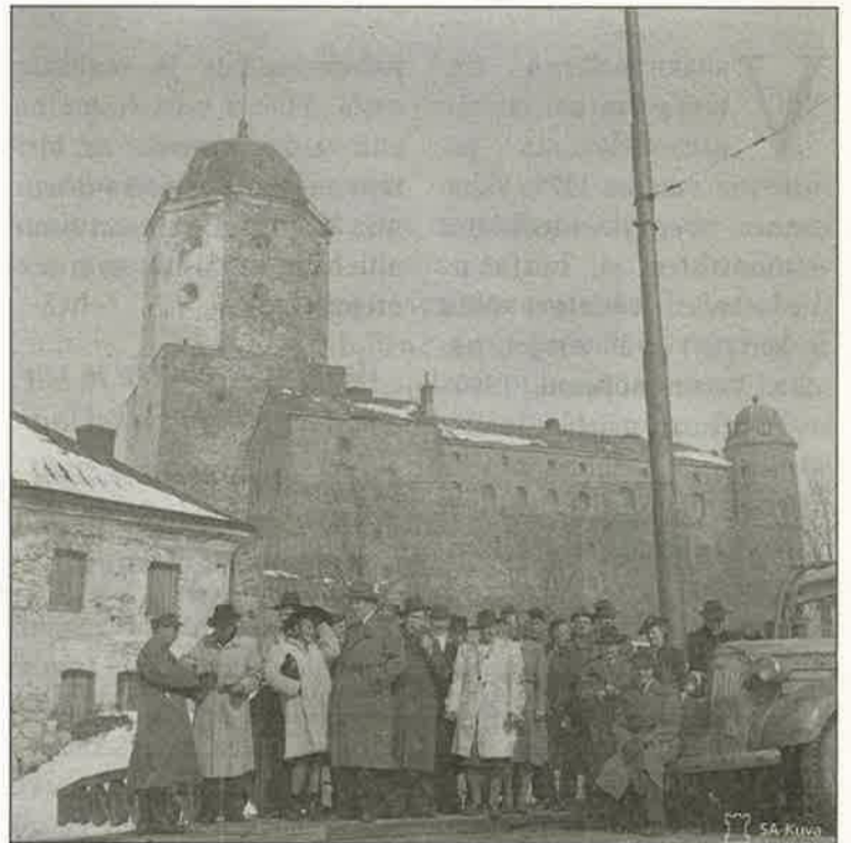
Ruotsiin lähetetään 500 Viipurin ja Kannaksen lasta. Lasten lähetystä oli seuraamassa ruotsalainen sanomalehtimiesretkikunta. Retkikunta linnan edustalla 1.5.1944

Seuraavat 46 vuotta Viipuri oli neuvostokaupunki. Neuvostoliiton aluehierarkiassa se oli rajamaata ja periferiaa, johon alettiin vähitellen panostaa vasta kauden lopulla. Neuvostoliiton kaaduttua Viipuri alkoi hiljalleen elpyä ja viimeiset kymmenkunta vuotta ovat ol-