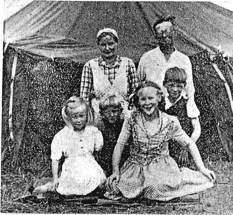
Iilahden perhe telttansa edustalla.

Kaikenlaisten kesäleirimmme elämälle antavat oman värinsä teltat, joissa onkin mukava asustaa viikon tai pari, mutta sitten leiriläinen jo mielellään muuttaa tukevampaan asuntoon. Kesäisen maakuntamme rauhaa häiritsevät sirkuskierrot levittelevät losin telttojaan silloin tällöin jonkin kirkonkylän liepeille ja nuhainen kuuluttajaklovi kirkuu kyläläisille: »Tulkaa katsomaan, vielä ehtii, vielä ehtii». Eipä taida heidänkään elämänsä olla mukavuuksilla pilattu. Mutta teltta suuren perheen jokapäiväisenä asuntona on harvinaisuus. Koska olimme kuulleet, että Vanhassa Vaasassa asuu neljä karjalaisperhettä teltoissa uuden kotinsa rakennusvaiheen aikana, kävisimme viikon lopulla seuraamassa näiden telttalaisten elämää.